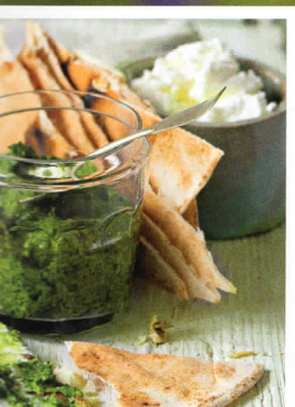
Dobroty plné chutí