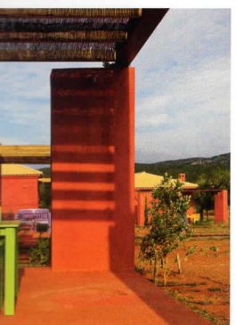
Dovolená na farmě